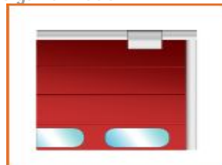
Kce montagem dentro do vão