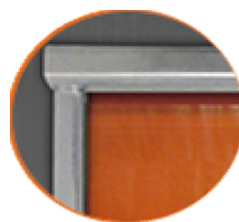
Estrutura de aço galvanizado